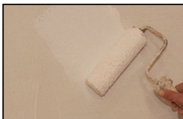
Étape 1 - application au rouleau de la sous-couche d'accroche Argilus.