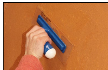
Étape 4 - à mi séchage, resserrer l'enduit à l'aide d'une spatule plastique souple.